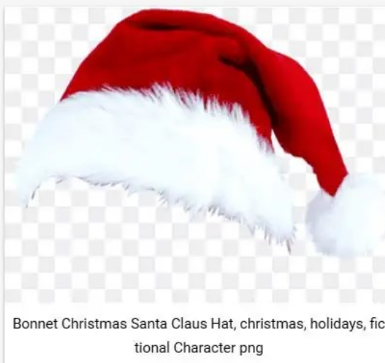
Bonnet Christmas Santa Claus Hat, christmas, holidays, fictional Character png

Klik op de afbeelding die je wilt downloaden en een nieuw venster opent zich. Scroll naar beneden tot onder het plaatje en klik op deze balk: