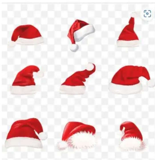
nine Christmas hats, Santa Claus Christmas, Christmas hats, hat, christmas Decoration png