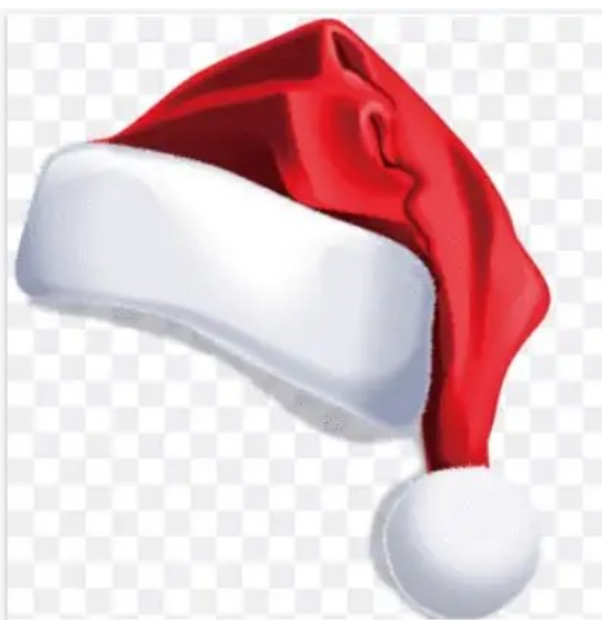
Hat Bonnet Christmas Icon, Christmas hats, angle, christmas Decoration png