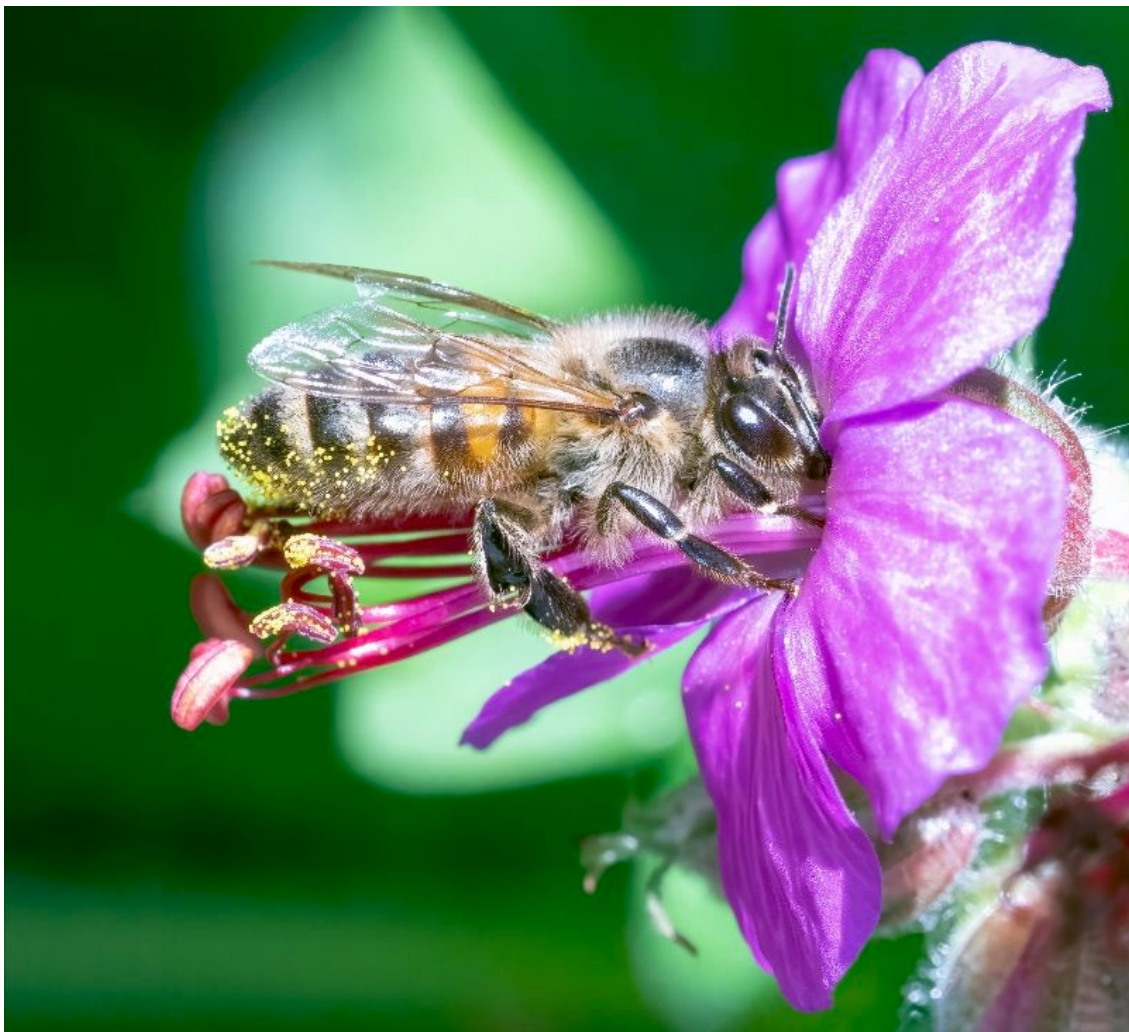
F10 - 1/500 s. - ISO 400 - Correctie + 0 - macro 90 mm