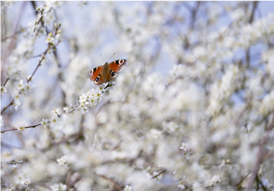
F6.3 - 1/1000 s. - ISO 350 - Correctie + 0,7 - telelens 600 mm

Het leukst is het om het beeld interessanter te maken met een tweede element. Dat kan een insect zijn, een vogel, een zonnester etc.