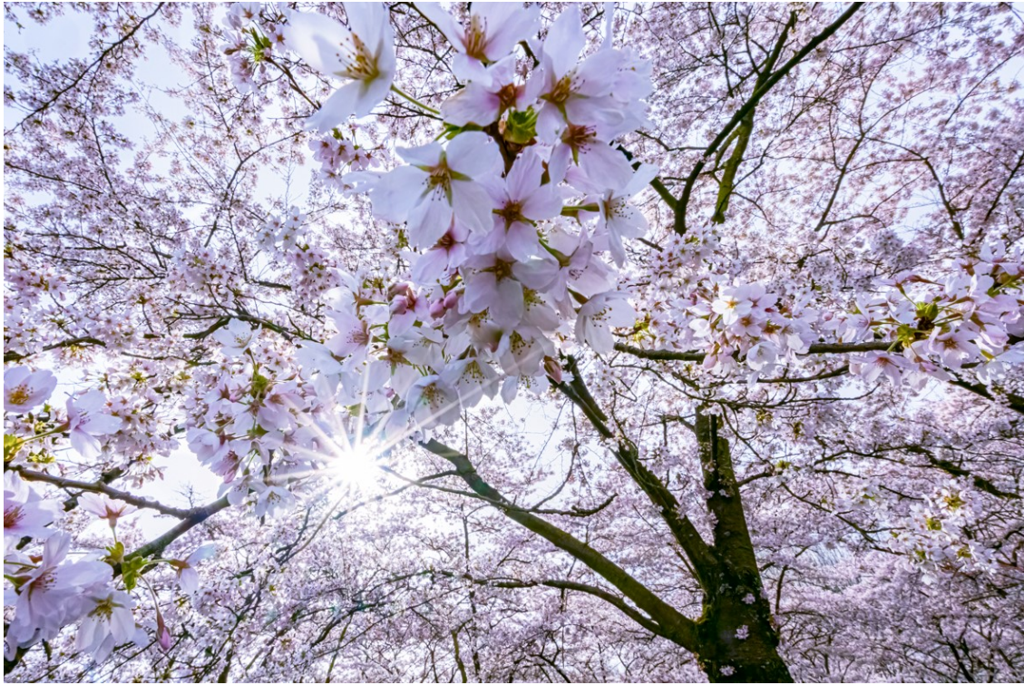
F22 - 1/1000 s. - ISO 6400 - Correctie + 1 - groothoek 16 mm